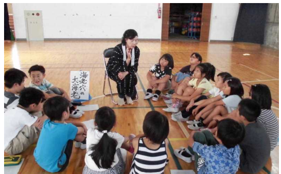
～柴田語り部の会（海老穴の大海老の話）～

今年も、多くの地域の皆様にお力添えをいただきました。給食ボランティア、読み聞かせ、米作り、さつまいもの栽培、柴田語り部の会、ミシン学習サポート、剪定草刈りなど、多くの地域の皆様から絶大なご支援・ご協力をいただき、児童の学習面の充実や安全な環境整備に大きな成果を上げることができました。お陰様で、本校の子供たちには地域や地域の皆様を愛する心が育っています。来年も、これまで同様、子供たちに、温かい励ましやお声掛けをいただければと存じます。ご支援・ご協力、ありがとうございました。今後ともどうぞよろしくをお願いいたします。